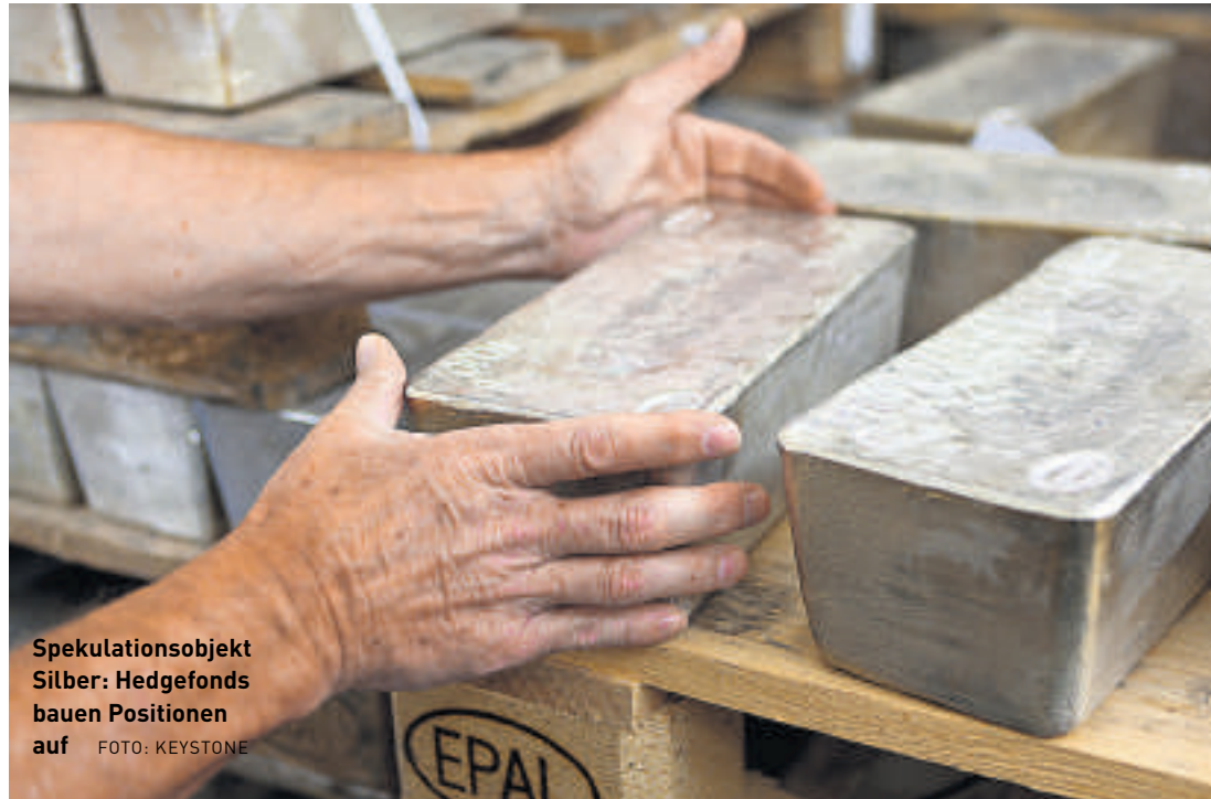
Spekulationsobjekt Silber: Hedgefonds bauen Positionen auf

Wie Gold ist auch Silber als Inflationsschutz, wenn nicht gar als Katastrophenwährung gesucht. Das widerspiegelt sich in der steigenden Nachfrage nach «American Silver Eagle»-Münzen. Sie werden als Alternative zum Dollar gehortet. Nicht von ungefähr haben